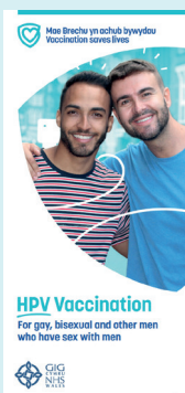
HPV Patient Information Leaflet

Free patient resources are available on our Health Information Resources page including: